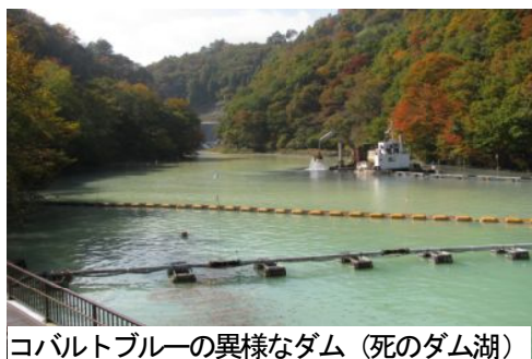
コバルトブルーの異様なダム (死のダム湖)

草津温泉の下に強酸性の温泉の排湯などを中和する工場があり、その下流には品木ダムがあります。このダムは、中和したときにできる硫化カルシウムなどの生成物を堆積させることを目的としています。上流にある2つの中和工場で、1日60トンもの石灰を投入し