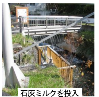
石灰ミルクを投入

船（堆積した生成物を毎日除去するための船）が動いていました。管理作業をしていた人に魚が居るか尋ねたところ、「数年前にフナを放流したがみんな奇形になってしまふので今はなにも居ない」と言っていました。