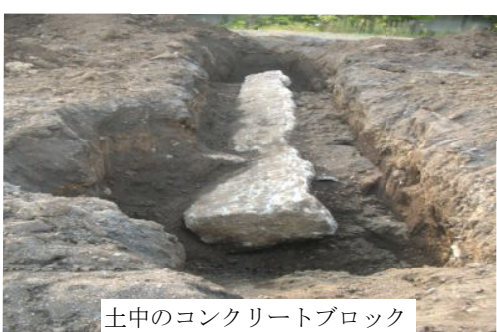
土中のコンクリートブロック

据え付ける土台に大量のコンクリートを使用し、そのまま土中に放置されている事が判明し調査が行われていました。掘削溝からはその姿がのぞいていました。また、遠藤新設計の旧平岡レース事務所も見学しました。