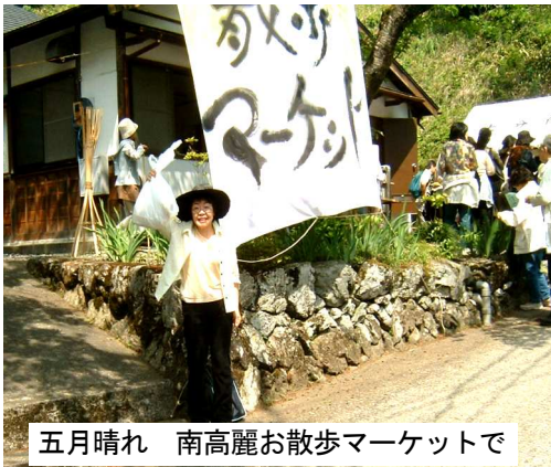
五月晴れ 南高麗お散歩マーケットで

3月議会では、市役所庁舎別館建設（5億9千万円）を中止して、切実な市民要望に予算を回すようにと「予算のくみかえ動議」を提出し奮闘しましたが、自民・公明の反対で否決されました。6月議会では、「改正」介護保険制度の問題点や市内の公立保育所の統合や民営化問題、地域の要望をとりあげてがんばります。