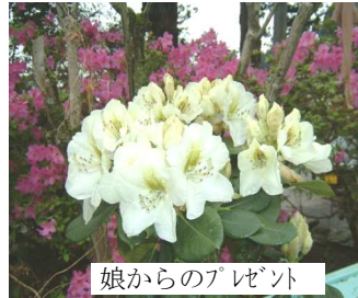
娘からのプレゼント

発行責任者金子としえ 飯能市飯能1237-2 Tel 972-6401 携帯090-7422-3993 ハートフル便 NO. 9 2006年5月発行