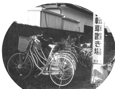
利用者の多い新寺駐輪場

建設部関係では、市道の改修や排水対策を、市民生活関係では、カーブミラーやバス停の改善を求め、特に、「妻沢や中藤の市道が暗く、自治会管理の防犯灯が多いことから市管理の道路照明灯