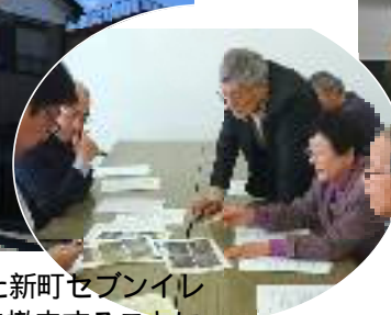
厚労省・国交省と交渉

市民アンケートに寄せられた県道や市道の整備、腐食した公園の柵の改修、街路灯の設置など現地調査を行い、要望書にまとめて市と交渉しました。