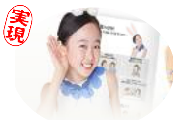
軽・中度難聴児の補聴器購入費補助が実現しました