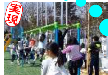
学童保育補助金を増やし保育料引き下げと処遇改善が実現