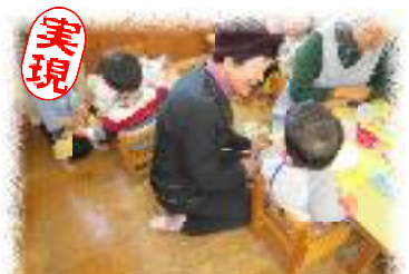
多子世帯の保育料が軽減できました