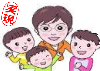
保育士の処遇が改善できました