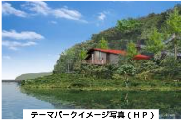
テーマパークイメージ写真(HP)

報告によりまずと、昨日(29日)フィンテックグローバル社より連絡があり、メッツァ事業の開発行為申請については、既に市において許可がされ、現在、事業主であるフィンテックグローバル株式会社と、飯能市内の建設業者を中心とした共同企業体として、工事請負契約に向けた最終調整が行われているとのことでした。そのほか、メッツァの有料エリア